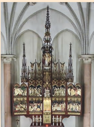
Altar Corpus Christi