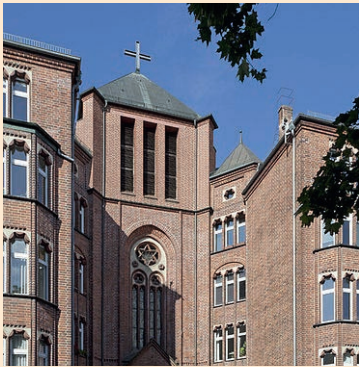
Kirche Corpus Christi

Wir rufen zur Spende für die Planung und Umsetzung für ein moderneres, zuverlässigeres und nachhaltigeres Heizkonzept in Corpus Christi auf. Unsere 30 Jahre alte Heizungsanlage soll in Zukunft durch eine Alternative ersetzt werden. Auch an Dämmung und Isolierung der Gebäude der Gemeinde gibt es Optimierungsbedarf. Der Einsatz von Solarthermie kann uns unabhängiger von fossilen Brennstoffen machen. Die Planung für diese Themen läuft bereits, muss aber gut durchdacht werden und benötigt Zeit. Experten auf dem Gebiet machen sich ein Bild von der Lage und geben ihre Einschätzung ab.